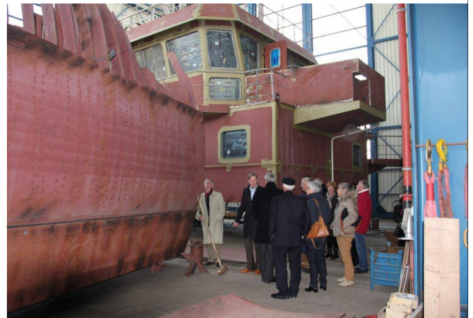
En wij zagen geavanceerde technologie om scheepsrompen te maken die zich krachtig door het Russische ijs boren