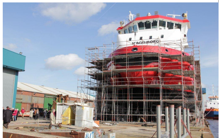
Schepen worden in onderdelen gebouwd en aan elkaar gelast

In het Muzeeaquarium leidt Bert ons rond in het maritieme deel, waarin een prachtige verzameling van scheepsmodellen, navigatie- en communicatie apparatuur, is te vinden. Scheepsvormen, die niet alleen veranderen door voortschrijdend inzicht in stabiliteit en voortstuwingseffectiviteit, maar ook door de eisen die de te vervoeren lading stelt, Steenkool, of sinaasappels, hout of chilisalpeter, en de bestemming van de lading, die kan vragen om het breken van ijs. Schepen met zeil alleen, met zeil en stoomvoortstuwing, de verzekeraars die aanvankelijk zeilschepen veiliger vonden dan die stombakken, die konden ontploffen en zonder machine stuurloos werden. Het nautische deel van het museum is bijzonder belangwekkend, terwijl elders in het gebouw aquaria en schelpenverzamelingen zijn. Het geheel drijft op gedreven vrijwilligers, waar Bert er duidelijk een van is. Wij begrepen dan ook de weerzin van deze mannen tegen gemeentelijke plannen om het huidige museum te slopen en de inhoud over te brengen naar een nieuwe zeer kostbare huisvesting ver van de haven, en met een entree verhoging van 5 naar 20 euro per persoon. Grote kosten, weinig geld bij het publiek in de komende