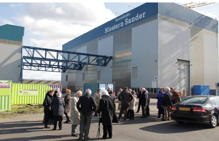
Niestern –Sander bouwt door Wagenborg ontworpen schepen voor inzet bij oliewinning in Kaspische Zee (!)

En dan heeft Bert het woord over het familiebedrijf. Grootvader vervoerde in de tjalk samen met zijn broer als enige bemanning ladingen tussen Engeland, Noord Denemarken en Delfzijl. In 10 jaar varen hadden zij de boot eruit en waren in staat een verladingskantoor op de wal in te richten, eerst in de kroeg, later in eigen winkel. Zij hadden een netwerk, en creatief in het vinden van oplossingen voor alles wat met verladen van goederen te maken had. Het speelde in de tijd van de opkomende stoomvaart, waarbij de kustvaart nog lang op zeilschepen werd voortgezet. Er werden langzamerhand eigen schepen gekocht, aanvankelijk tweedehands, later nieuw. De ouwe Wagenborgs dronken niet, waren vegetariërs en bouwden een reputatie op van te doen wat ze beloofden. Ook mensen moesten worden vervoerd, zo ontstonden regulier diensten zowel met goederen als met passagiers. Bleven de passagiers vooral tussen het vaste lande en de waddeneilanden, de vrachten gingen verder en verder en zo ook de dienstverlening van het verladen en het zoeken van oplossingen voor aanpassing van schepen aan telkens veranderende transportbehoeften, het zij door aanbod van nieuwe goederen hetzij door wijziging